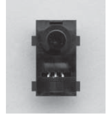
分離型受光素子 Separate Receiving Optics