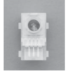
分離型発光素子 Separate Light Emission Diode