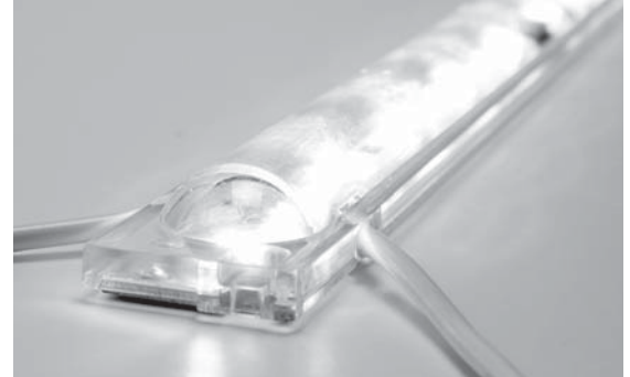
RSN-DW8C-1T39(ロングサイズ 340mm) AC100V仕様